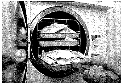
Figura meramente ilustrativa